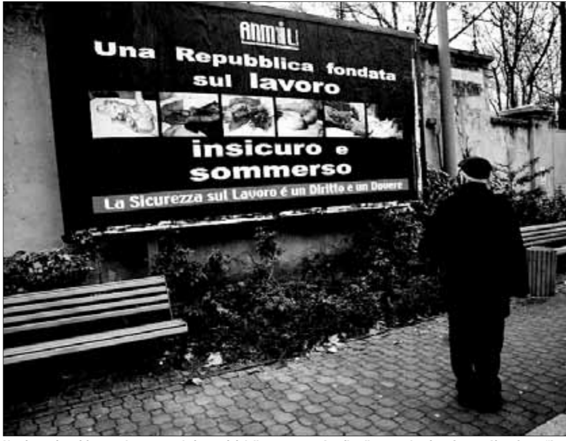
Un piacentino si ferma ad osservare le immagini della campagna Anmil collocate a barriera Genova

Al debutto i manifesti Anmil in via XXI Aprile, via Genova, Barriera Torino, via Farnesiana, via Colombo e via XXIV Maggio: strade molto trafficate